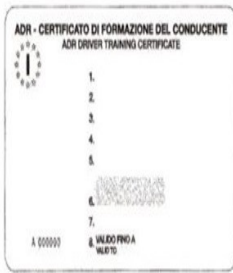
Mod. MC 723F - Recto