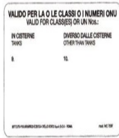
Mod. MC 723F - Verso